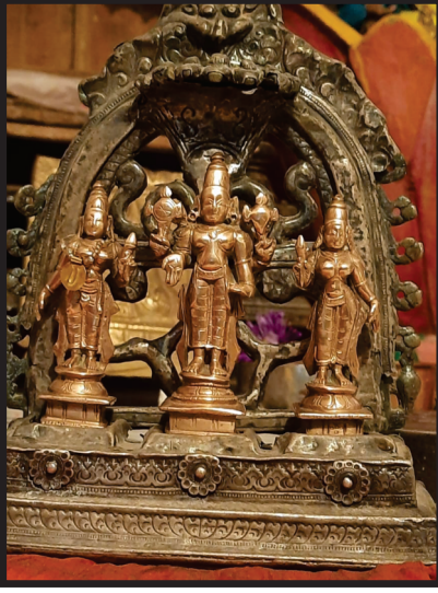
ಶ್ರೀಶ್ರೀವಿದ್ಯಾಭಾಸ್ಕರತೀರ್ಥರ ಪೂರ್ವಾಶ್ರಮದ ಪೂರ್ವಜರಿಗೆ ಅರಜಿಚೆಕ್ಕಿನಲ್ಲಿ ದೂರತ ದೇವರ ವಿಗ್ರಹಗಳು.