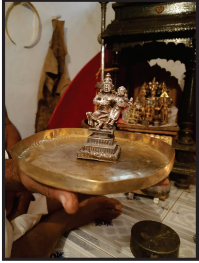
ಶ್ರೀ ರಾಯರ ಮಠದ ಶ್ರೀ ಪಾದರು ಶ್ರೀ ವಿದ್ಯಾಭಾಸ್ಕರತೀರ್ಥರ ಪೂರ್ವಾಶ್ರಮದ ಪೂರ್ವಜರಿಗೆ ಕೊಟ್ಟ ಶ್ರೀಪಟ್ಟಾಭರಾಮ ದೇವರು